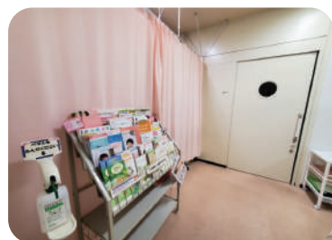
←外来通院治療室 入り口

がん薬物療法の実施においては安全管理が重要となります。外来通院治療室の一角に薬剤調製室を配置し、薬剤師が個人防護具着用の上、専用の安全キャビネットを用いて無菌で薬剤の調製を行っています。実施の際は、薬剤師、看護師にて事前に内容を確認することで投与スケジュールや投与量の過誤防止に繋がっています。